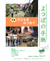
よつばの手紙 第20号