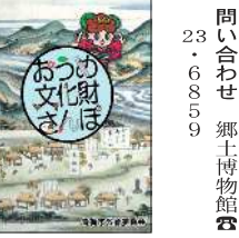
おつめ文化財さんぽ