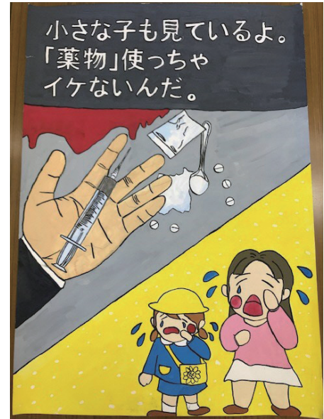
△昨年のポスター部門会長賞