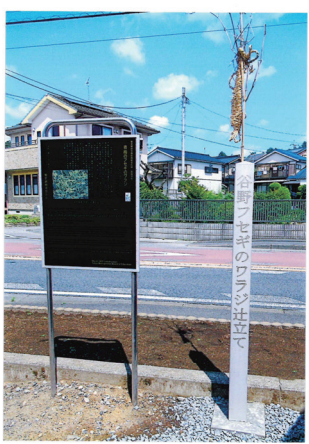
△新しく建てられた辻立て(谷野)

市内では、疫病や悪霊が村に入らないように、または村の中にある災厄を村の外に追い出すことを目的に、村境にしめ縄やワラジなどを吊るし、自分たちの生活の場を守る災厄払いの「フセギ」の行事が行われてきました。 災厄除けなどの祈願のために大きなワラジを製作し、旧村境に吊るしているのは、都内で岩蔵地区と谷野地区だけとなり、生活文化を示す風俗慣習行事として貴重であることから、都の無形民俗文化財に指定されています。