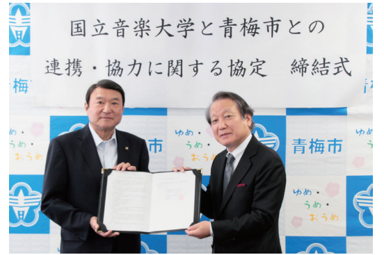
▷右 国立音楽大学 武田忠善 学長、左 浜中市長

6月24日に「国立音楽大学と青梅市との連携・協力に関する協定」を締結しました。本協定は、地域貢献のための各種事業、教育および人材育成、文化の育成・発展について連携・協力し、地域社会の芸術、文化、教育、まちづくり等の振興を図ることを目的としています。次代を担う子どもたちをはじめ、多くの市民にとって、芸術に触れる機会のさらなる充実が期待されます。協定締結を機に、今後、国立音楽大学とともに文化活動のさらなる発展に向けて、取り組んでいきます。