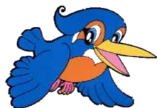
ボートレース多摩川公式キャラクター 「ウェイキー」