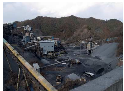
市内採石場の様子