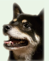
実施動物病院一覧（動物病院名の50音順に掲載）

環境政策課窓口で行っている鑑札・済票の交付を動物病院でも実施します。 狂犬病予防のため、犬の飼い主には、飼い犬の生涯1回の登録と、毎年1回4～6月に狂犬病予防注射を受けさせ、市町村から済票の交付を受けることが法律で義務づけられています。 令和3年度は、特例として期間を令和3年12月31日まで延長しています。期間内に狂犬病予防注射と済票の交付の手続きをお願いいたします。 実施動物病院 下表参照 ▽鑑札：3千円 ▽済票：550円 ※注射接種費用、診察費等が別途かかります。 ※市役所でも例年同様、鑑札、済票を受けることは可能です。（交付手数料は同額です） 注意事項 ▽令和3年3月15日までに登録した犬の飼い主：市から送付された「令和3年度狂犬病予防集合注射について」と記載されたハガキ（オレンジ色）を必ずお持ちください。 ▽3月15日以降に登録した犬の飼い主：ハガキが送付されないことが あります。4月1日時点で届いていない場合は、ご連絡ください。 ▽動物病院には、鑑札・済票の交付業務のみ委託しています。鑑札・済票の再交付、転入や住所変更、死亡届 （死亡届は電話も可）等の提出は、環境政策課（市役所5階）へお越しください。 問い合わせ 環境政策課 管理係