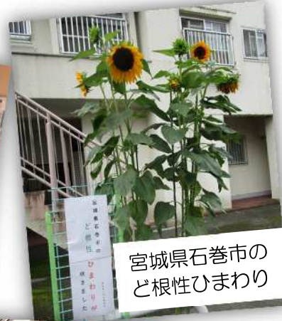
宮城県石巻市のど根性ひまわり