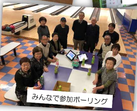
みんなで参加ボーリング