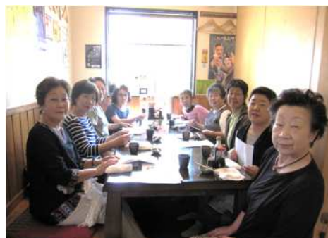
3か月に1回、活動報告と同時に食事会