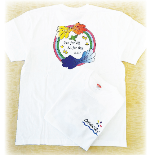
青梅の魅力Tシャツ