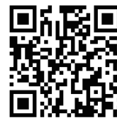
霞台小販売サイト