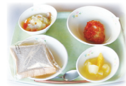
ドイツ風野菜スープとカツレツ

市では、ドイツに関する小さなイベントを集中的に実施する「ドイツウィーク」を開催してきました。今回は、10のドイツホストタウンが参加し、1月25日～31日に実施しました。市では、学校給食や市内飲食店でのドイツメニューの提供、ドイツの国旗をイメージしたライトアップなどに取り組みました。詳細は市ホームページ（記事ID…28660）をご覧ください。