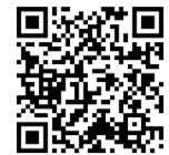
市ホームページ (二次元コード)