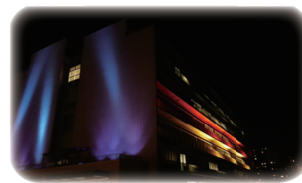
△市役所庁舎のライトアップ