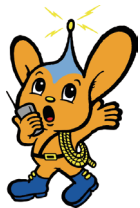
自動通話録音機の貸与

問い合わせ 青梅警察署 防犯係☎22-0110 内線2612、市市民安全課市民安全係