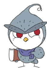
図書館妖怪♥ち〜のん

日時=1月11日(祝) 午前11時~11時20分▷会場=梅郷市民センター多目的室▷対象=0歳以上▷定員=先着15人