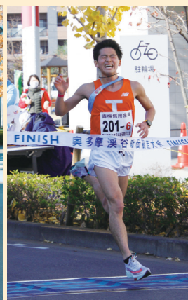
▲拓殖大学A (大学の部優勝)