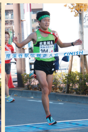
▲武蔵越生A (高校の部優勝)