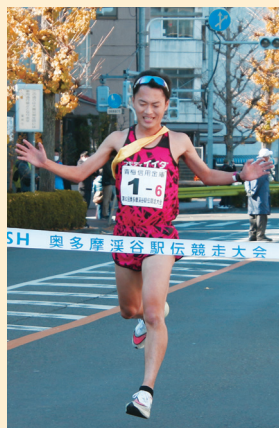
▲コモディイイダ (一般の部優勝)