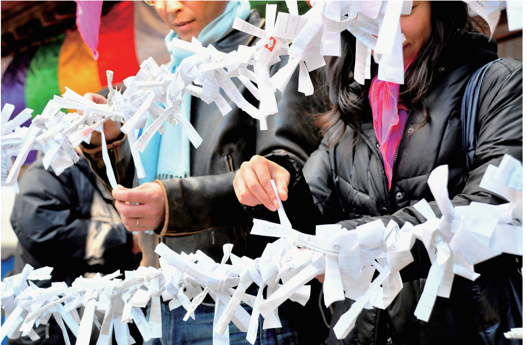
幸 せ 結 び 仲條年春さん（河辺町6丁目）の作品

青梅市の人口 令和2年12月1日現在（前月との比較） 世帯数 63,896世帯（20世帯減） 人口 132,256人（94人減） （男） 66,417人（62人減） （女） 65,839人（32人減）