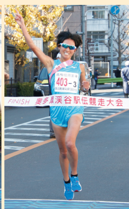
▲富津合同練習会A (女子の部優勝)