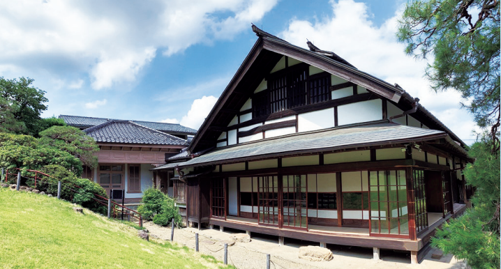
△野村貞文生家(現吉川英治記念館)

●10月1日〜7日は公証週間 東京公証人会では、特設電話(03・3502・8239)を設置