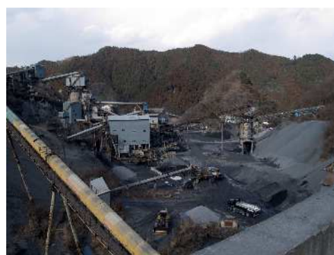
市内採石場の様子