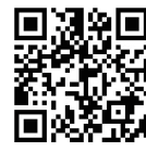
△自衛隊福生募集案内所

官公庁への就職を希望する方を対象に、青梅市、警視庁、東京消防庁、防衛省（自衛隊）による合同採用説明会を開催します。 入場無料 服装自由 ※マスクを着用してください。 申し込み 自衛隊福生募集案内所のエントリーフォームから申し込み（予約制） 時間 ▽第1回：午後1時30分～3時 ▽第2回：午後3時30分～5時 ※午後1時開場 会場 市役所議会議棟3階 大会議室 内容 ①業務概要プレゼンター シヨク：各団体の業務内容の紹介 ②個別相談：各団体の担当職員が相談に応じます。 問い合わせ 市職員課 事務給係