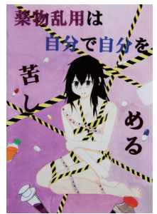
△昨年のポスター部門会長賞