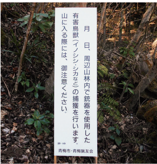
月 日、周辺山林内で銃器を使用した有害鳥獣(イノシシ・シカなどの)捕獲を行います。山に入る際には、御注意ください。

わせて行うことが重要です。 皆さんのご理解とご協力をお願いします。 問い合わせ 農林水産課 農政係