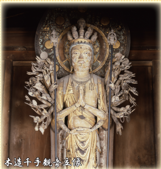
木造千手観音立像

文化財保護法にもとづき、建造物、美術工芸品や歴史資料などの中で、歴史上・芸術上・学術的に価値の高いものとして、国が指定した有形文化財のことを言います。今回の指定により、国指定文化財は、市内で18件となりました。