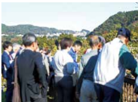
圃場見学をする生産者たち

電気柵の貸出については、市で行っているのので、必要とされる方は市役所農林水産課農政係まで御連絡ください。