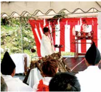
椎茸御収穫祭の様子

毎年11月に、国と国民の安寧や五穀豊穡を祈って行われる伝統的な儀式【新嘗祭】の中でも、新しい元号となる天皇即位後に初めて行われる特別な儀式が【大嘗祭】です。